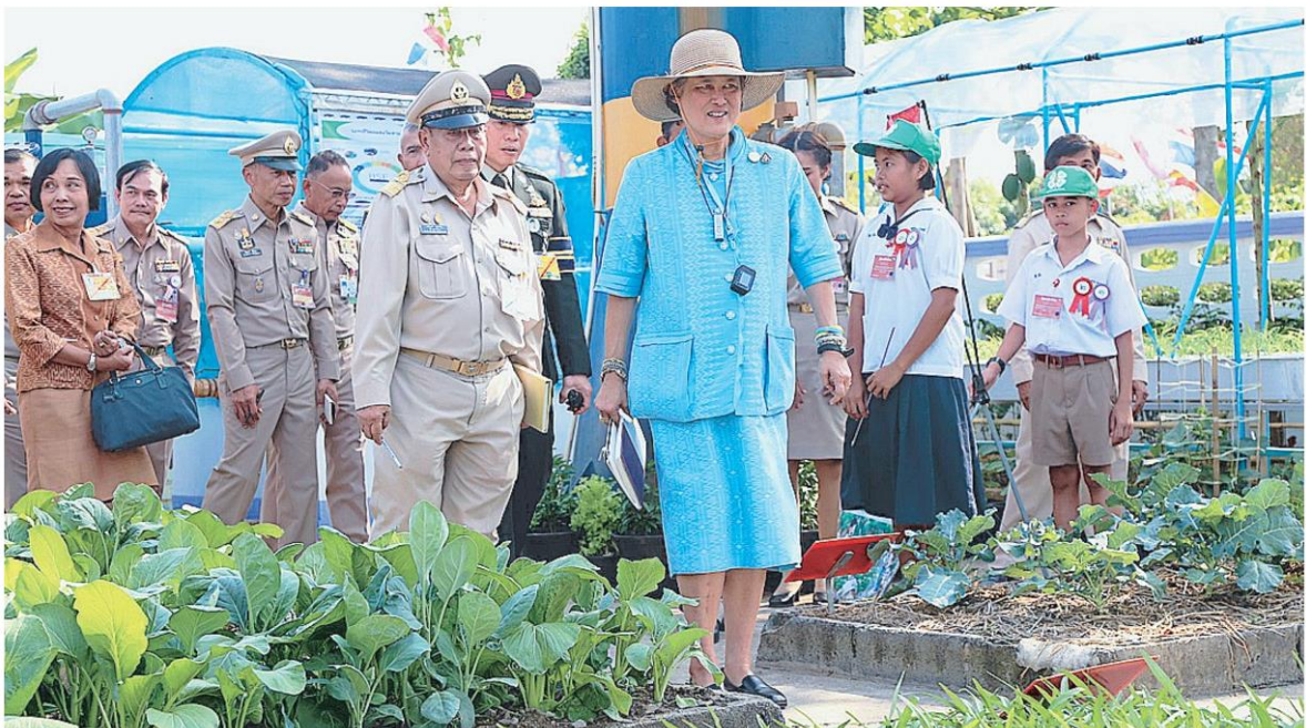
สมเด็จพระกนิษฐาธิราชเจ้า กรมสมเด็จพระเทพรัตนราชสุดาฯ สยามบรมราชกุมารี เสด็จฯทอดพระเนตรผลงานผลิตภัณฑ์นักเรียนโรงเรียนในโครงการตามพระราชดำริ ณ โรงเรียนวัดพรหมณี จ.นครนายก เมื่อวันที่ ๑๕ ธันวาคม.