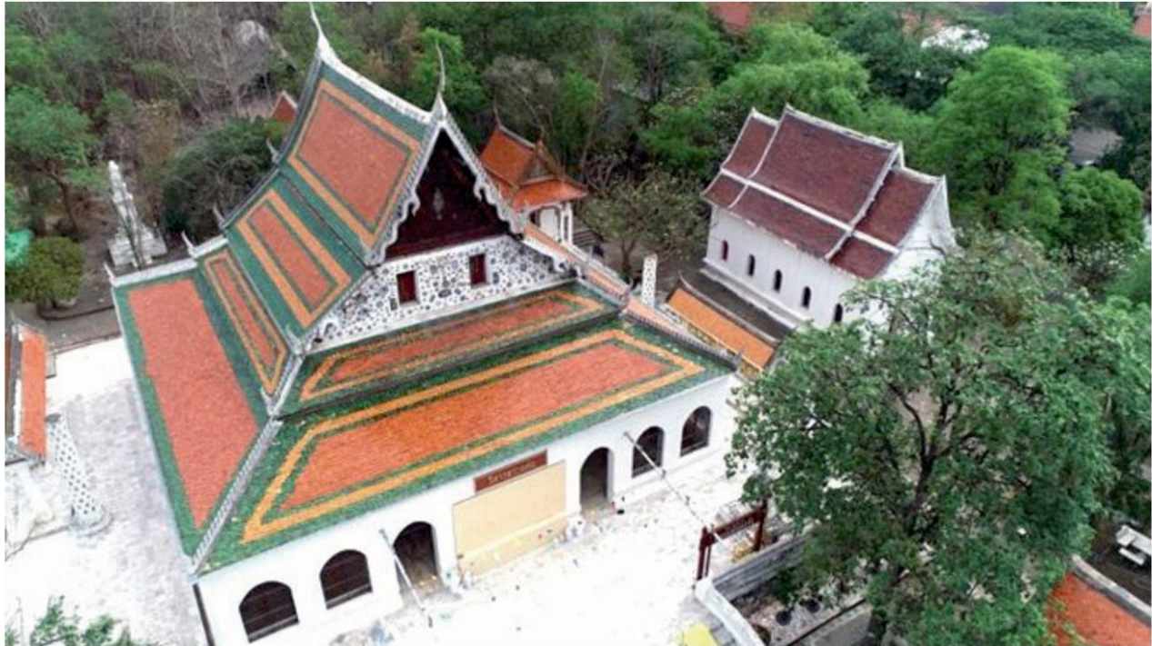
วิหารพระแท่น วัดพระแท่นดงรัง ต.พระแท่น อ.ท่ามะกา จ.กาญจนบุรี (ภาพจากโดรนมติชนทีวี)

ว ัดพระแท่นดงรัง เป็นวัดใหญ่มีประวัติศาสตร์อันยาวนาน ตั้งอยู่ที่อำเภอท่ามะกา จังหวัดกาญจนบุรี มีปูชนียสถานที่สำคัญ คือมีการสร้างพระแท่นสมมติเป็นพระแท่นมณีนิพพาน มหาชนทั่วประเทศรู้จัก เพราะมีการทำพิธีสักการบูชาทุกปีนับแต่กรุงศรีอยุธยาเป็นต้นมา เป็นโบราณสถานที่ยังกำหนดไม่ได้ว่า ใครสร้าง และสร้างมาแต่ยุคไหน