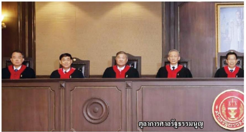
ตุลาการศาลรัฐธรรมนูญ

หมัดไปจากข่าวรั่วออกมาเป็นระยะเมื่อคณะกรรมการการเลือกตั้ง(กกต.) มีมติเสียงข้างมาก 5 ต่อ 2 ส่งศาลรัฐธรรมนูญวินิจฉัยยุบพรรคอนาคตใหม่ ตามมาตรา 92 วรคหนึ่ง (3) ประกอบมาตรา 93 แห่ง พ.ร.ป.ว่าด้วยพรรคการเมือง