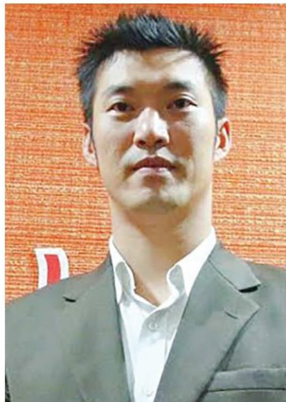
ธนาธร จึงรุ่งเรืองกิจ

กรณีพรรคอนาคตใหม่ กู้ยืมเงินจาก นายธนาธร จึงรุ่งเรืองกิจ หัวหน้าพรรค จำนวน 191,200,000 บาท