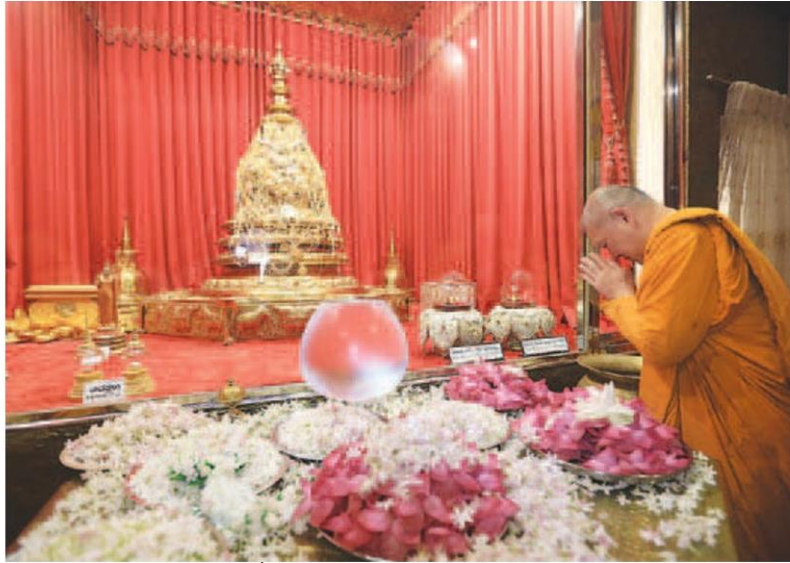
พิธีอัญเชิญ 'พระบรมเกศาธาตุ' จากประเทศศรีลังกา