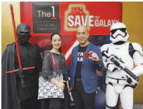
แคมเปญ Save The Galaxy

■ 20-31 ธ.ค. Gift Fest 2020 งานจำหน่ายสินค้าของขวัญ ของฝาก ของแต่งบ้าน ของที่ระลึก ไอเดียมีเอกลักษณ์ 40 บูธ ณ ลานโปรโมชั่น ชั้น บี ศูนย์การค้าพิวเจอร์พาร์ค