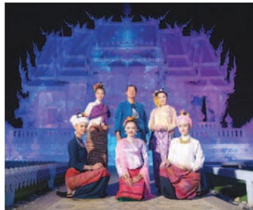
วัดร่องขุน ไฟท์ เฟสต์ : ตอน 'ปฐมบท' รอบสุดท้าย

■ 22 ธ.ค. วัดร่องขุน ไฟท์ เฟสต์ ตอน ปฐมบท (Wat Rong Khun Light Fest, Episode: Begins) งานแสดงศิลปะผสมผสานการแสดงแสงเสียง และดิจิทัลเทคนิคมัลติมีเดียกับ 6 จุดแลนด์มาร์ค ของ 'วัดร่องขุน' เปลี่ยนสี-เปล่งแสงยามค่ำคืน รอบสุดท้าย รวมไปถึงการแสดงมิวสิคัลจุดที่ 6 ณ หอพระพิฆเนศ พาผู้ชมย้อนเรื่องราวการเดินทาง ของชายหนุ่มในหมู่บ้านเล็กๆ ในจังหวัดเชียงรายผู้ ต่อสู้กับโชคชะตา อุปสรรค และความเชื่อ สู่ศิลปินแห่งชาตินาม เฉลิมชัย โฆษิตพิพัฒน์ และ เชิญชวนร่วมสวมใส่ชุดไทยไปเก็บภาพบรรยากาศ สวยๆ ณ วัดร่องขุน จ.เชียงราย รายได้ส่วนหนึ่ง จากการจำหน่ายบัตรเข้าชมมอบโรงพยาบาล เชียงรายประชานุเคราะห์ ช้อบัตรคลิก www.thaiticketmajor.com หรือโทร.0 2262 3456