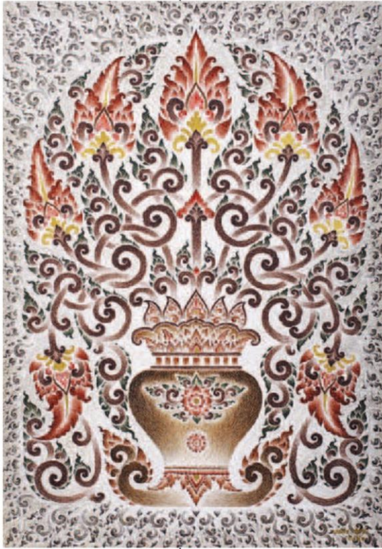
หม้อดอกบุรณขลุ่ย-

บนพรหมดอกไม้ เมืองหนาวสีโกเมน ออกแบบโดยศิลปิน ชื่อดัง, นิทรรศการ ดอกไม้เมืองหนาว เฉลิมพระเกียรติ รัชกาลที่ 10 จาก ศูนย์ส่งเสริม การเกษตรที่สูง จังหวัดเชียงราย, องค์การบริหารส่วนจังหวัดเชียงราย, เทศบาลนคร เชียงราย และกลุ่มข้าวศิลปะเชียงราย, เวิร์คชอป ดอกไม้กินได้จากมหาวิทยาลัยราชภัฏเชียงราย การจัดดอกไม้สวยงามจากวิทยาลัยอาชีวศึกษา เชียงราย ดนตรี-บัลเลต์โชว์บนพรหมดอกไม้ ตลาดนัดขายสินค้าอาหารขมหวานจากดอกไม้ ณ บริเวณชั้น 1 ลานกิจกรรม เซ็นทรัล เชียงราย ■ 19-22 ธ.ค. Commart Work 2019 มหกรรม สินค้าไอที, โชนพิเศษ GSB Future Banking สัมผัสประสบการณ์ธนาคารแห่งอนาคตและโลก สังคมไร้เงินสด, โชนช้อปเครื่องใช้ไฟฟ้าแบรนด์ชั้นนำ ไปรษณีย์จาก The Power by HomePro ช้อครบ ทุก 3,000 บาท ลุ้นรับรถยนต์ Suzuki Celerio